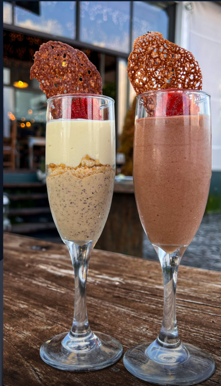
MOUSSE DE CAFÉ Y AMARETTO